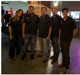
Servicarga, S. A.