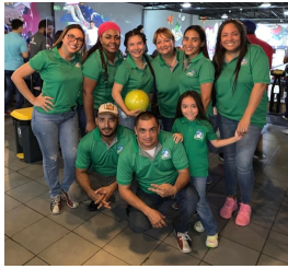
Air Sea Express Cargo, S.A.