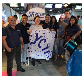
VCYM Transport and Logistics