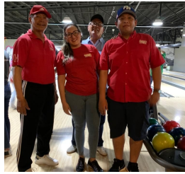
Tocumen Storage & Crago Service.