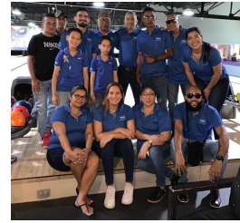
Air Sea Worldwide Panama, S.A.