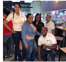
N2A Full Safe Logistics, S.A.