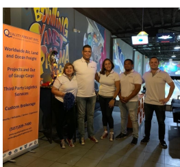
Quality Freight International.