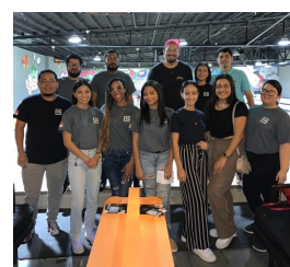
SSL International Group Corp.